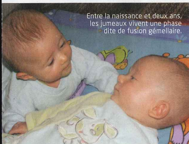
Entre la naissance et deux ans, les jumeaux vivent une phase dite de fusion gémellaire.

Petit à petit, la maman reconnaît chaque enfant, repère son rythme, ses caractéristiques (agité, sage, goulu...). « Dans ce lien particulier avec chacun, les parents doivent veiller à